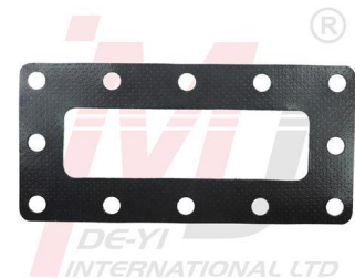
4000716 Junta de Conexión