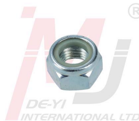
3089271 Tuerca de Bloqueo