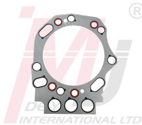
3649982 Junta de Culata