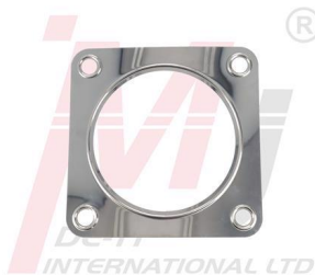
3171306 Junta de Conexión de Salida de Escape