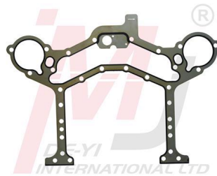
4006223 Junta de Carcasa del Volante